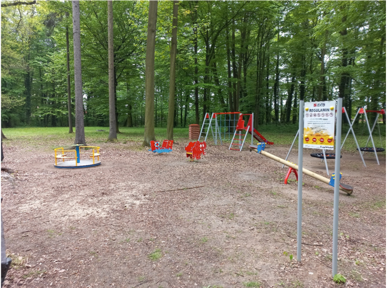
Fot. 4 Plac zabaw

5. Przedmiotem konkursu będzie użyczenie terenu oraz zagospodarowanie przestrzeni przeznaczonej dla prowadzenia punktu gastronomicznego oraz opracowanie koncepcji działań i ich realizacja w ramach projektu „Wyspa Rehdanza”.