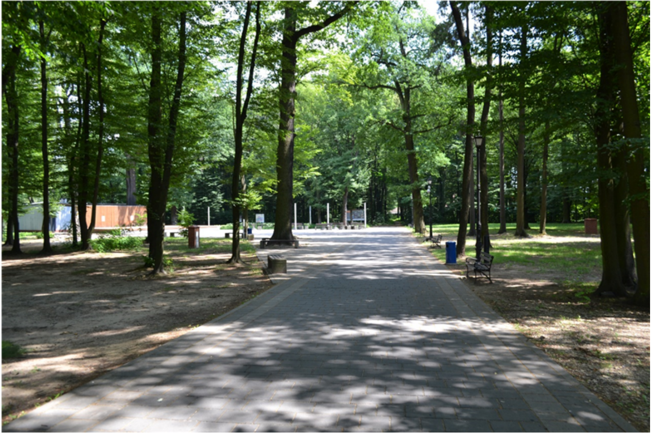
Fot.2 Ścieżka pieszo-rowerowa