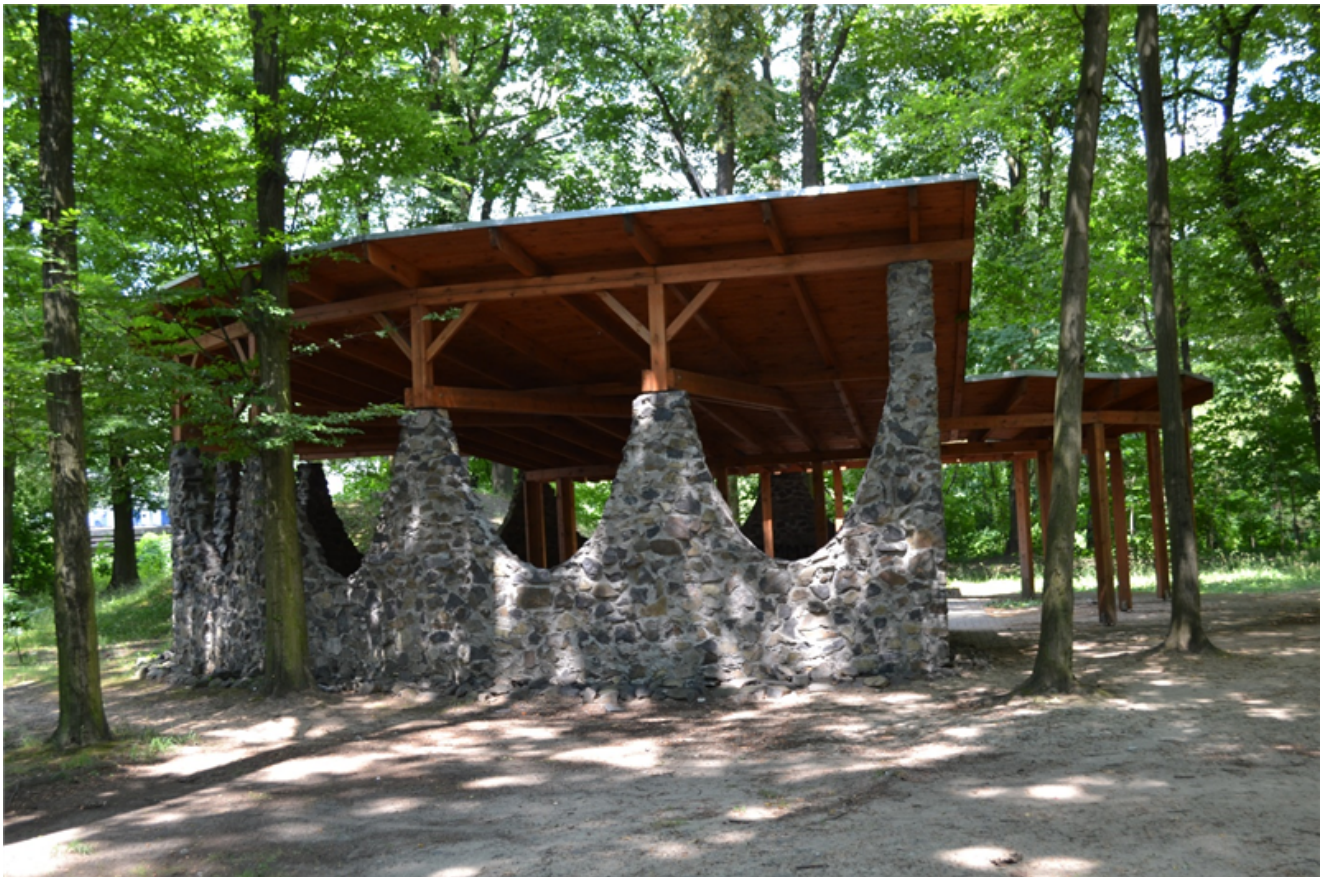
Fot. 3 Wiata drewniana