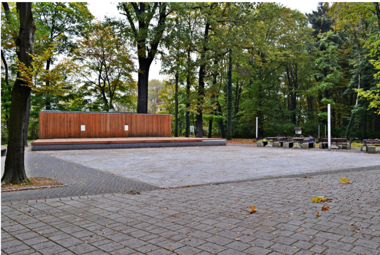
Fot. 1 Scena do wydarzeń kulturalno-artystycznych

4. Nieruchomość w głównej i przeważającej części stanowi teren rekreacyjno-wypoczynkowy, w miejscowym planie zagospodarowania przestrzennego przeznaczona jest pod tereny zieleni parkowej B.ZP.